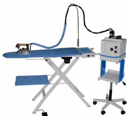
1A02 CON GENERATORE 1F42