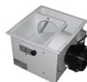
GRUPPO ASPIRATORE PER MOD 1A02S