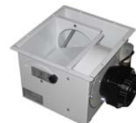
Deviatore aria per mod.1A18