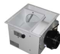
Deviatore aria per mod.1ARS