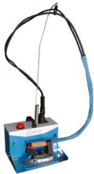
Mod. 1F43 + electric iron