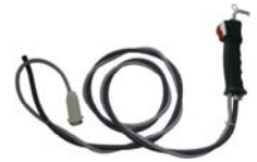
Mod. steam gun