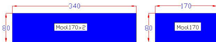
Le Forme RETTANGOLARI De1 Piano Stiro Della Serie TRA10-TRA11-FGA10-FGA11 dimensioni in cm.