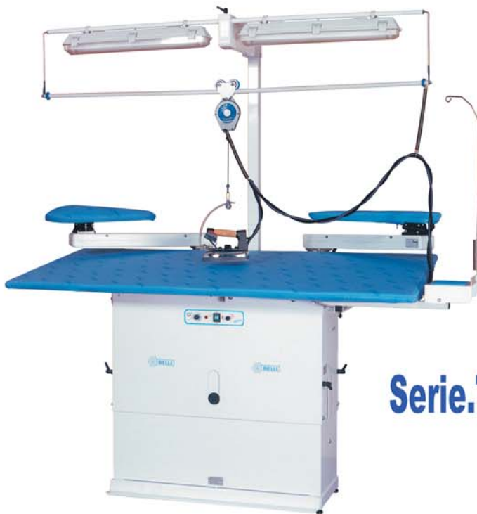
Serie.TRA9 . FGA9