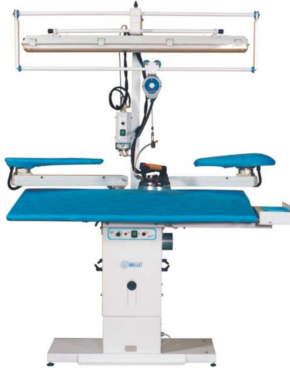
Serie.TRA8 . FGA8